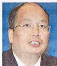
I CHUEJ-MAN prezident ICBC

e Industrial & Commercial China zvýšila zisk – údajně nadhodnoceným aktivům – objasnobil odpisy nesplácející na tři miliardy dolarů.